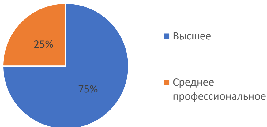
Распределение педагогов по уровню квалификации